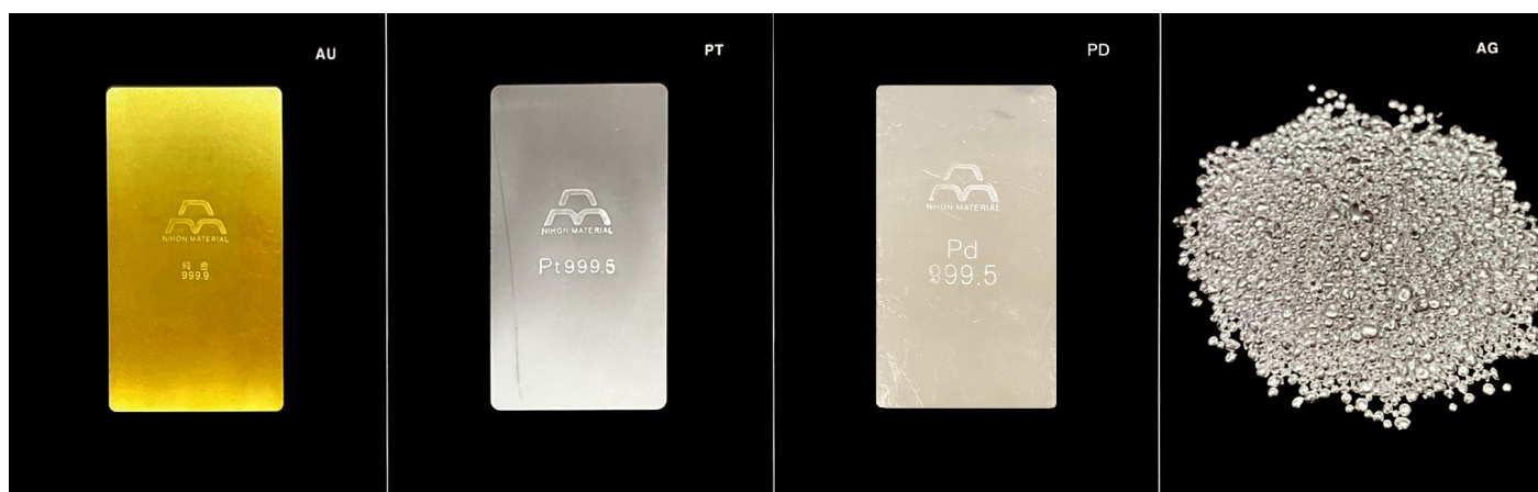
左から順に金、プラチナ、パラジウムの板材、銀のショット プラチナとパラジウムは99.95%、金と銀は99.99%の純度を保証いたします。

ジュエリー制作後の端材や溜まったスリ粉・バフ粉は 工場にて精錬分析を行い、金・プラチナ・パラジウム・銀の4種類を元素ごとに取り出して買取、 もしくは材料の形で納品いたします。